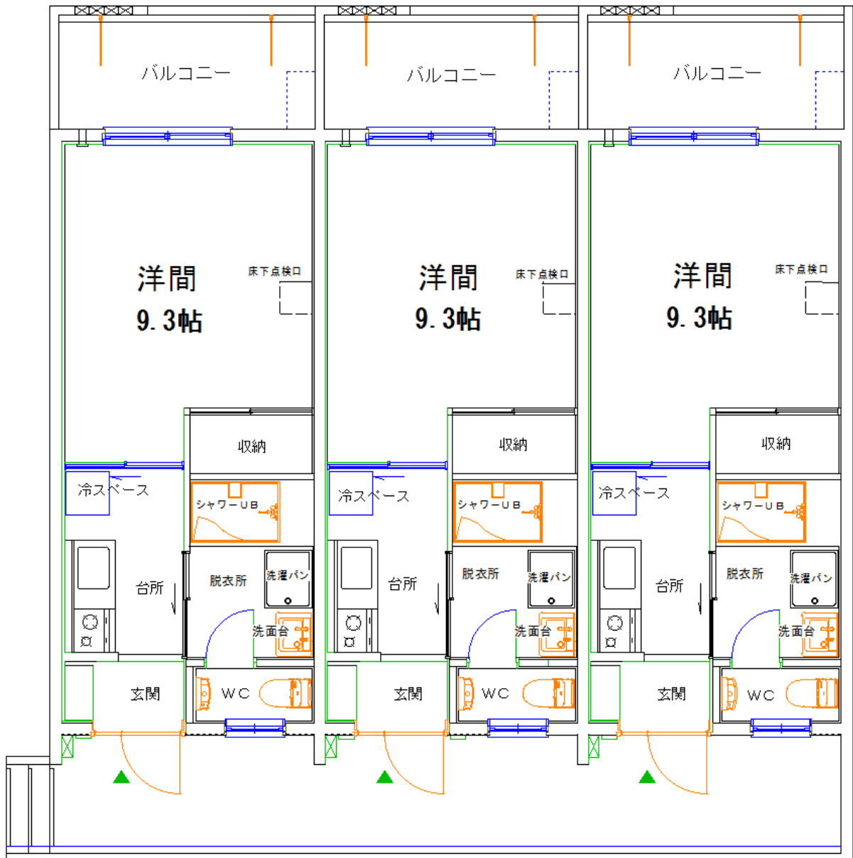
仲田区定住促進住宅 1号棟 (1階建)