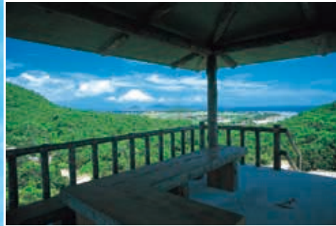
伊是名山森林公園の休憩所より、仲田、諸見、伊平屋島まで見渡せます。