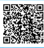
伊是名島観光マップ

伊是名島は、沖縄本島の北、東シナ海に浮かぶ周囲16kmの島です。息をのむほど美しい自然や尚門王生誕の地として琉球王国の歴史やゆかりの人物たちの足跡が残り観光客の目を惹きつけてくれます。琉球王国の歴史を感じるこの常盤の島で本島とは一味違うもう一つの沖縄を感じに来てください。