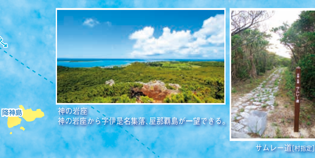
神の岩座 神の岩座から伊是名集落、屋那覇島が一望できる。