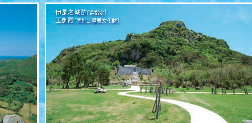
伊是名城跡 [県指定] 玉御殿 [国指定重要文化財]