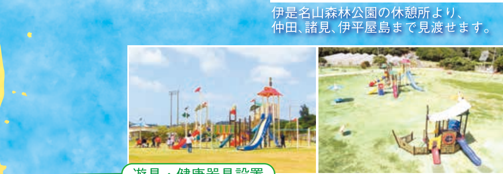
遊具・健康器具設置