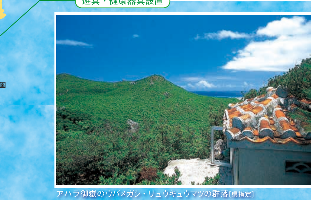
アハラ御嶽のウバメガシ・リュウキュウマツの群落 [県指定]