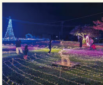
伊是名村臨海ふれあい公園

11月下旬頃から、村内各地域でイルミネーションのライトアップが始まり行き交う人々の目を楽しませていました。伊是名村臨海ふれあい公園では5回目となる「しまのイルミネーション」が開催され鮮やかな電飾や飾りが広場を埋め尽くし、ギンネムの木を利用した「ギンネムツリー」は樹木とライトアップで癒やしを感じさせます。