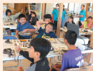
日高小児童へのフォトフレームも心を込めて作成しました。

11月12日～13日の日程で伊是名小学校との親善交流を予定していましたが、台風26号の影響で船が欠航となり日高小が来村できなくなりました。楽しみに準備していた全体交流会や夕食交流会は予定通り実施し、日高を訪れた際に紹介することとしました。