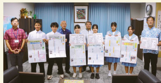
コンクールの成績を村長へ報告(11/4)

生徒達は夏休み期間中に、村における「少子高齢化問題」や「ゴミ問題」、「伝統行事」に着目し、村役場や地域住民などの取材を通して内容を記事にし、生徒全体での取り組みが県審査会において高く評価され、学校賞を受賞しました。