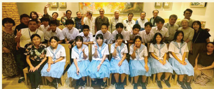
～アハラ会・各体験職場の皆さんありがとうございました～

また、アハラ会主催による生徒激励会にも参加し、緊張した様子で職場体験談を発表するなど、とても充実した職場体験学習となりました。