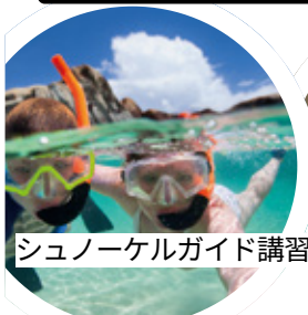
シュノーケルガイド講習