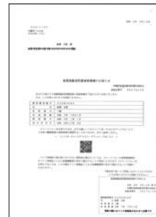
資格情報のお知らせ(みほん)

マイナ保険証の利用登録をされている方へ交付されるご自身の資格情報(被保険者番号、負担割合等)を確認することができるお知らせです。 ※資格情報のお知らせのみでは、病院等を受診はできませんのでご注意ください。